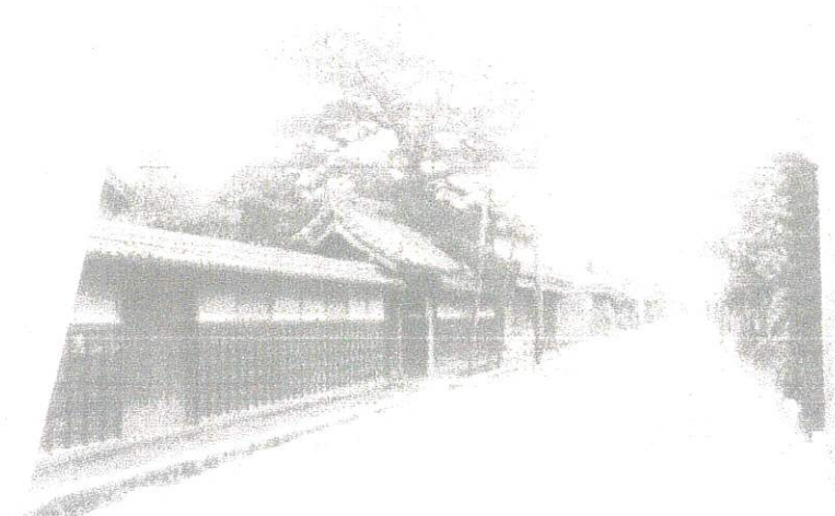
昭和5年頃の伊勢街道（斎宮）の様子（大西源一氏撮影）