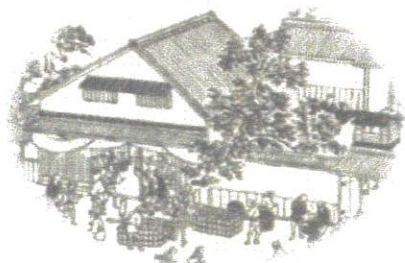
伊勢参宮名所図会（斎宮）