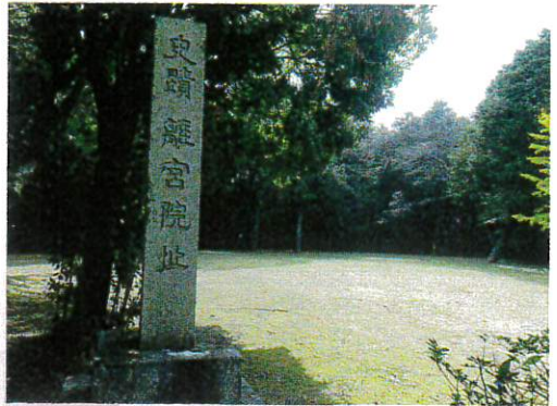
国史跡離宮院跡 (伊勢市小俣町)

の祭祀への奉仕の次第はほぼ同様です。離宮院を出発して外宮ないしは内宮に到着した齋王は、輿(こし)華輦(かかれん)から軽量な手輿に乗り換えて、大宮院の中にあった齋内親王侍殿(外宮は齋内親王殿)に入りしました。女孀侍殿には齋王に仕えた女官(女孀)が入りました。ここで齋王は、女官長の命婦(内侍)を介して大官司から渡された木綿鬘を身に着け、受け取った太玉串を手に携えて瑞垣御門(正宮を囲む瑞垣に付く門)の前に進みます。太玉串は、櫛に麻の織維をつけたもので、これに神が宿るものと考えられています。