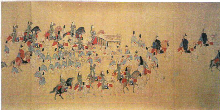
斎内親王参宮図（複製） 御巫清直考証、中村左洲画 斎宮歴史博物館蔵（原資料：神宮徴古館蔵）

斎王はそれぞれの祭が実施される前月の晦日、月次祭では近くの多気川（現在の祓川）で、神嘗祭では尾野湊（大淀浦）で禊を行いました。そして翌月の一五日に斎宮を出立して官川の手前にあった離宮院に入ります。その後は離宮院を基点にして、一六日に外宮、一七日に内宮へ赴き祭祀に奉仕して一八日に斎宮に帰りました。一五〜一七日の三日間いずれも離宮院に宿泊する三泊四日の行程でした。月次祭と神嘗祭における外宮および内宮での斎王